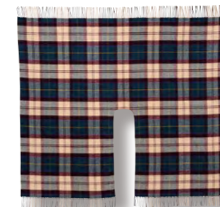
ティール ベージュ ブロック (メリノウール) 本体価格 ¥ 10,000

0385017800 JAN4992272627411 ショール/H125×W140cm(フリンジ含まず) ●ウール100%