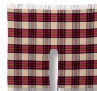
バックデン アモライト (メリノウール) 本体価格 ¥ 10,000

0385017600 JAN4992272627398 ショール/H125×W140cm(フリンジ含まず) ●ウール100%