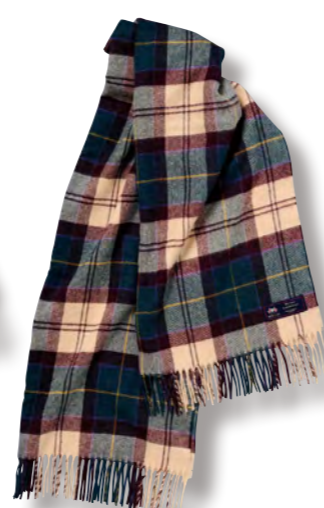
ティール ベージュ ブロック (メリノウール) 本体価格 ¥ 8,000

0385017500 JAN4992272627381 ストール/H170×W70cm(フリンジ含まず) ●ウール100%