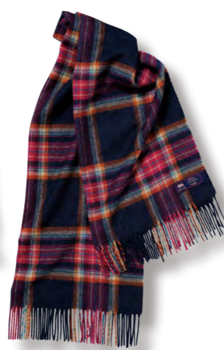
ピンク ブレイド (メリノウール) 本体価格 ¥ 8,000

0385017400 JAN4992272627374 ストール/H170×W70cm(フリンジ含まず) ●ウール100%