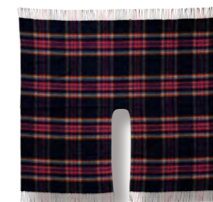
ピンク ブレイド (メリノウール) 本体価格 ¥ 10,000

0385017700 JAN4992272627404 ショール/H125×W140cm(フリンジ含まず) ●ウール100%