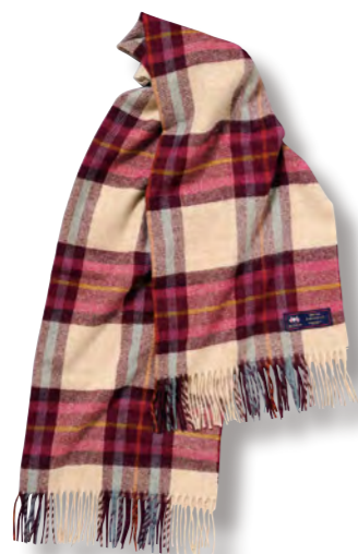
バックデン アモライト (メリノウール) 本体価格 ¥ 8,000

0385017300 JAN4992272627367 ストール/H170×W70cm(フリンジ含まず) ●ウール100%