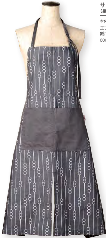
サイマ (染料プリント・織リネーム)

フィンランドの湖の名前、サイマ。 水辺の植物をモダンに あしらったデザインです。