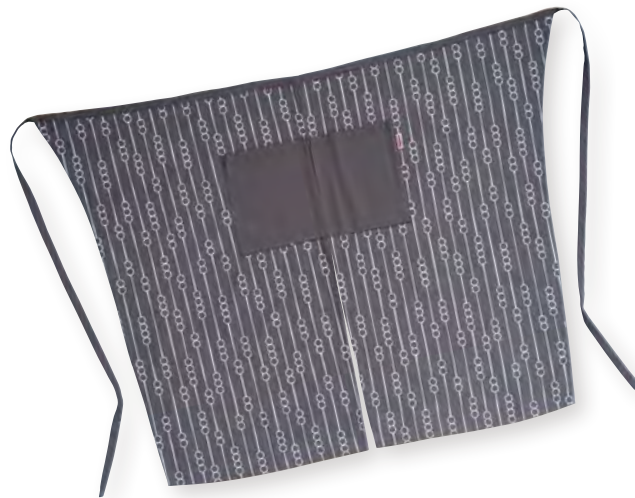
サイマ (染料プリント・織リネーム)

本体価格 ¥4,500 エプロン/H90×W95cm 綿100% 6065001700 JAN4992272633832