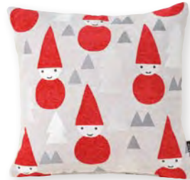
トムテクッション (ゴブラン織り・織りネーム)

※モール糸 (糸全体に直立した毛羽のある飾り撚糸の一種) ※ゴブラン織り(多色の緯糸で織る、細密で美しいタペストリーなどの織物技術)です。