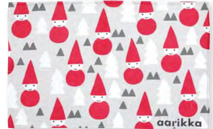
トムテマット (ゴブラン織り)

本体価格 ¥5,000 ラグ/H60×W90cm ポリエステル100% 6065004300 JAN4992272671650