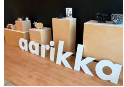
アアリッカ・コレクション