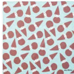
トムテクロス (染料プリント)

レッド 6065004400 JAN4992272671667 グレー 6065004500 JAN4992272671674 ブラウン 6065004600 JAN4992272671681