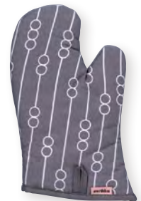
サイマ (染料プリント・織リネーム・耐熱綿)

本体価格 ¥1,500 鍋敷き/φ18cm 表生地:綿100% 裏生地:綿100% 詰め物:ポリエステル100% 6065002000 JAN4992272633863