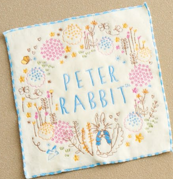
ガーデンオブピーター (シャーリング・全面刺繍)

本体価格 ¥600 ミニタオル/約25×25cm 本体:綿100% 刺繍部分:ポリエステル100% 5605004900 JAN4992272642551