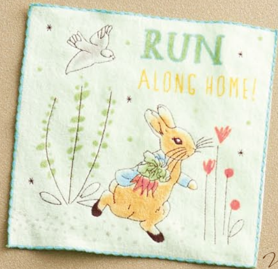
ランニングピーター (シャーリング・染料プリント・全面刺繍)

本体価格 ¥600 ミニタオル/約25×25cm 本体:綿100% 刺繍部分:ポリエステル100% 5605004900 JAN4992272642551