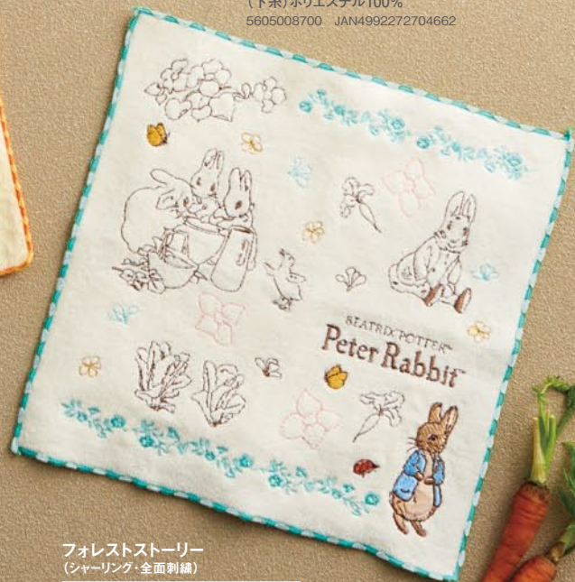
フォレストストーリー (シャーリング・全面刺繍)

本体価格 ¥600 ミニタオル/約25×25cm 本体:綿100% 刺繍部分:(上糸)レーヨン100% (下糸)ポリエステル100% 5605008300 JAN4992272704624